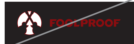
Logo in anderer Farbgebung