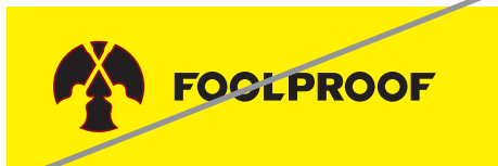
Logo auf anderer Farbe