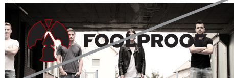
Logo auf Bild